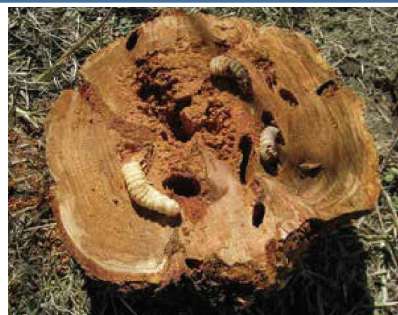
クビアカツヤカミキリの幼虫