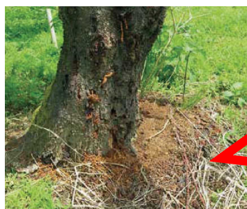
クビアカツヤカミキリのフラス