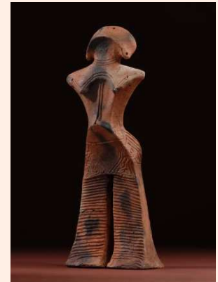
国宝土偶「縄文の女神」 （4,500 年前）