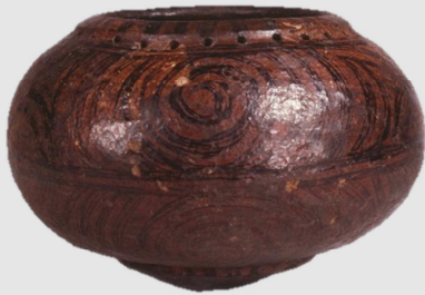
彩漆土器（重要文化財） （5,500 年前）