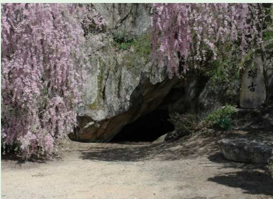
史跡 日向洞窟（高島町） （12,000 年前）