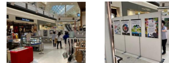
パネル展示の様子