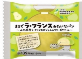
まるでラ・フランスみたいなパン ～山形県産ラ・フランスのジャム入りチーズクリーム～