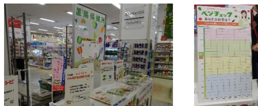
キャンペーンの様子