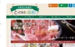
とっておきの山形