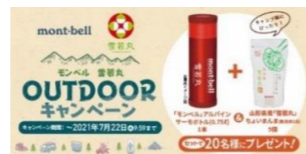
キャンペーン概要