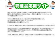
物産品応援サイト