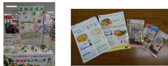
キャンペーンの様子