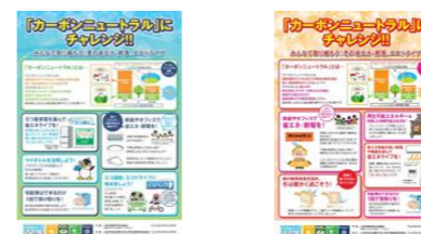
夏の取組みポスター(6月~9月)