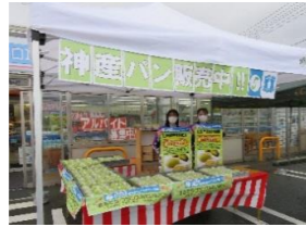
店頭での販売PRの様子