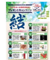
キャンペーン概要