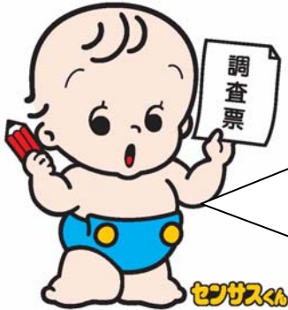
国勢調査キャラクター

総務省統計局では、社会・人口統計体系において整備した基礎データを用いて作成している統計指標の中から、都道府県別のものを「社会生活指標－都道府県の指標－2010」として報告書に取りまとめています。