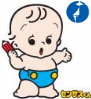
国勢調査ロゴ、キャラクター

国勢調査は、我が国に住んでいるすべての人を対象とする国の最も基本的な統計調査で、国内の人口や世帯の実態を明らかにするため、5年ごとに行われます。