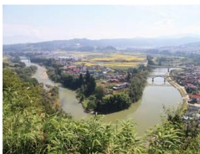
最上川中流域（大江町）