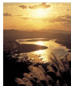
最上川下流域（酒田市）