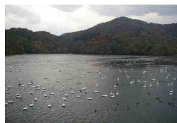
湖沼生態系 （大山下池）