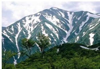
森林生態系 （大朝日岳）