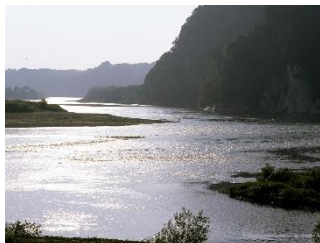
河川生態系 （最上川：新庄市本合海）