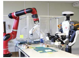
<モデル生産ライン> ロボット導入加速化支援・ 中小企業生産性向上推進事業