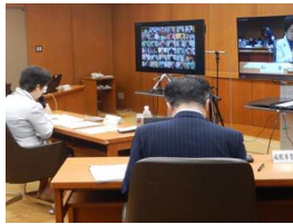
<オンライン会議の利活用> 県庁における 職場環境オンライン化推進事業