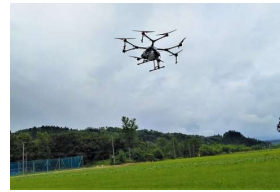
<農業用ドローン> やまがたスマート農業 普及推進事業