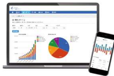
スマホで経理や確定申告