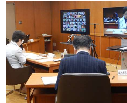
<オンライン会議の利活用> 県庁における 職場環境オンライン化推進事業