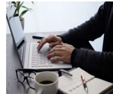
<テレワーク促進> モバイルワーク等の拡大・ 在宅勤務環境整備事業