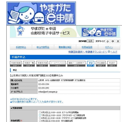
やまがたe申請による オンライン申請の推進