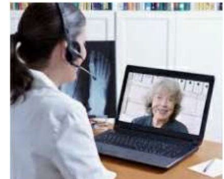
<オンライン診療> 院内感染を防止するため オンライン診療の導入支援事業