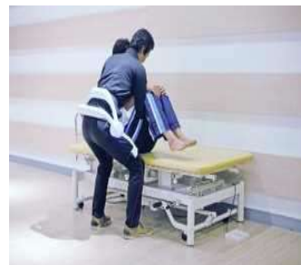
装着型パワーアシスト