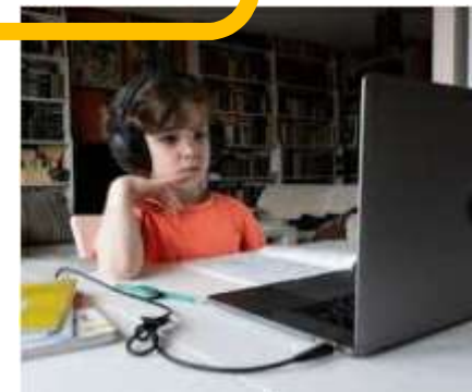
<オンライン教育> 〔 ICTを活用した 質の高い教育推進事業 〕