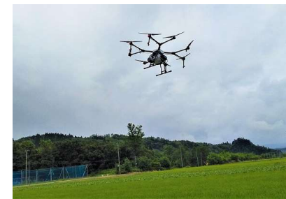
<農業用ドローン> 〔やまがたスマート農業 普及推進事業〕