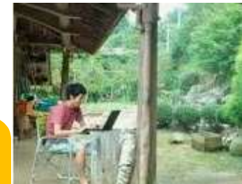
<里山・離島テレワーク> 〔コワーキングスペース〕 〔ネットワークモデル事業〕