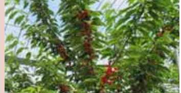
おうとう「紅秀峰」の里づくり (寒河江市 4地区)