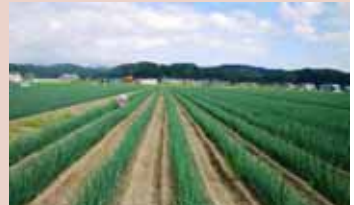
「ねぎ」の 大区画ほ場栽培 (鮭川村鮭川左岸地区)