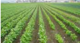
「だだちゃ豆」の産地拡大 (鶴岡市全域)