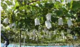
山腹から移行した「ブドウ」団地 (南陽市柗塚地区)