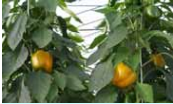
「パプリカ」の産地形成 (遊佐町漆首根、水上地区)