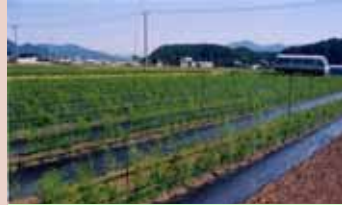
「アスパラガス」の 2億円産地 (最上町全域)