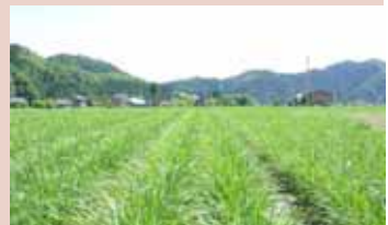
「にら」の広域産地 (金山町、真室川町他)