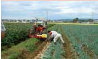
「赤ねぎ」の産地育成 (酒田市飛鳥地区)