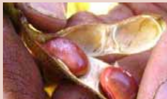
「紅大豆」での産地づくり (川西町たまにわ東沢、川西東部地区)