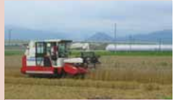
「大豆-小麦-ソバ」の2年3作栽培 (山形市村木沢、大郷、志戸田地区)

お問合せ 村山総合支庁 農業振興課 TEL 023-621-8144 農村計画課 TEL 023-621-8388