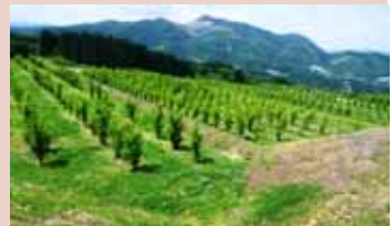
気候を活かした「啓翁桜」団地 (上山市鳴谷地地区)