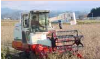
契約栽培による「秘伝大豆」栽培 (高島町亀岡地区)