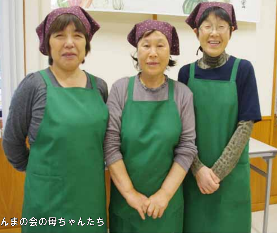
まんまの会の母ちゃんたち