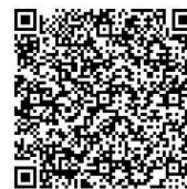
やまがたe申請（個人）