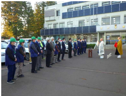
米沢署安全祈願祭