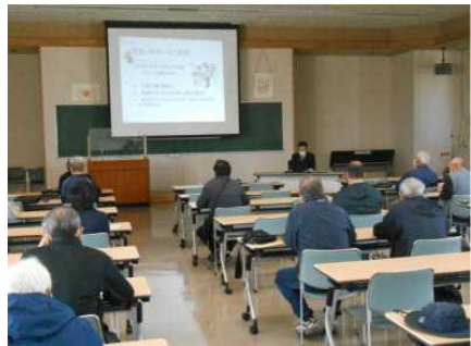
鶴岡署青パト講習

【県内の青パト情勢】 (令和3年5月末) 団体数171団体 台数2,286台 実施者数6,133人