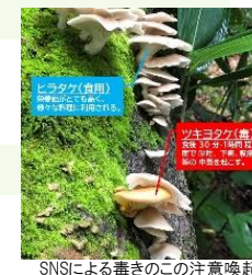
SNSによる毒きのこの注意喚起