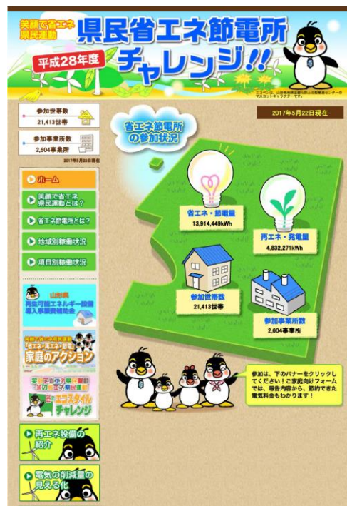
図1-3 県民省エネ節電所

開設したホームページでは、省エネルギー等の取組み成果（取組みにより削減された電力量）を「省エネ・節電量」、再生可能エネルギー設備の導入成果（導入設備の発電量）を「再エネ発電量」として市町村ごとに集計し、合計値を電球の大きさ・数で表現しています（図1-3）。