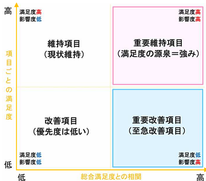
図 1 CS 分析結果の表現と各象限の意味

図 1 は分析結果の散布図における各象限の意味を示す。右上にプロットされる項目は、影響度が強く満足度が高い要因のため、その地域にとっての 強み 、逆に右下は 弱み (至急改善) 、左下は 弱み (長期改善) として見ることができる。