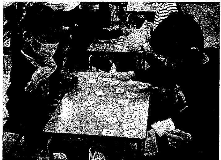
アルファベットカルタ