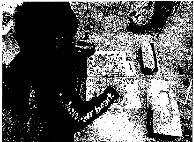
ポインティングゲーム