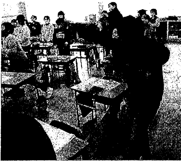
「ABC」の歌に合わせてダンス！