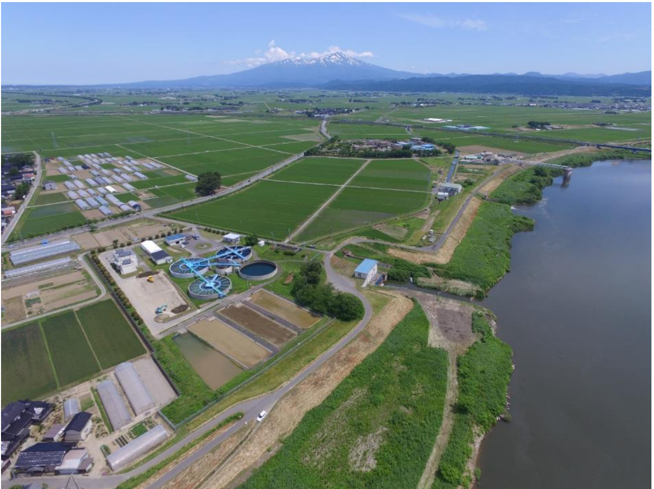
酒田工業用水道遊摺部浄水場