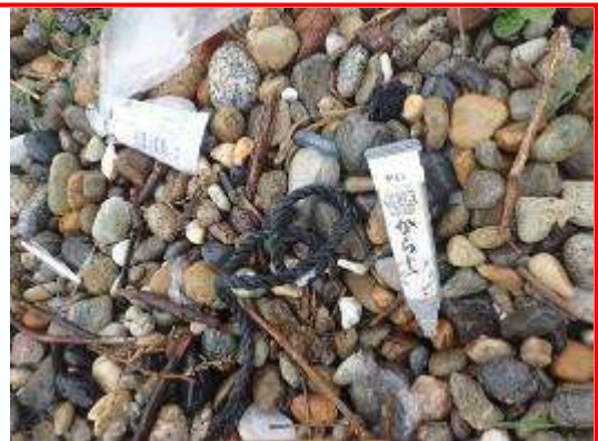
ようき チューブ容器