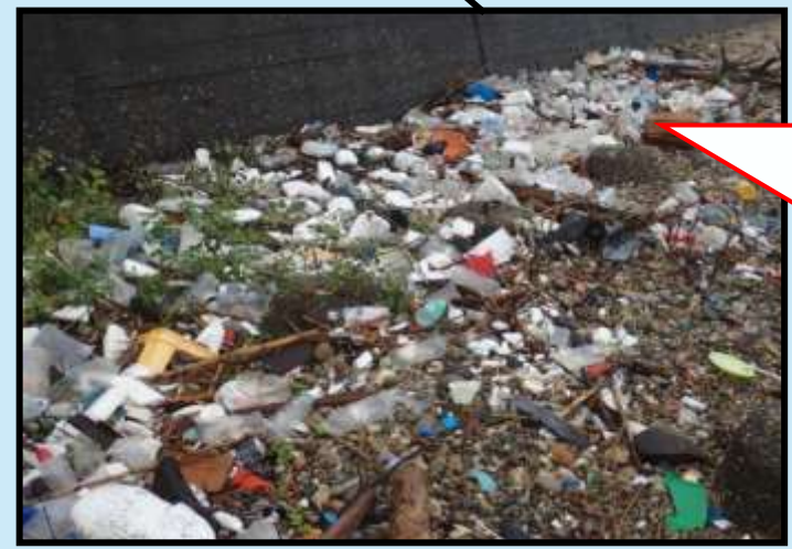
海岸に流れついたごみ