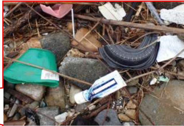
食品プラスチックケースの破片等