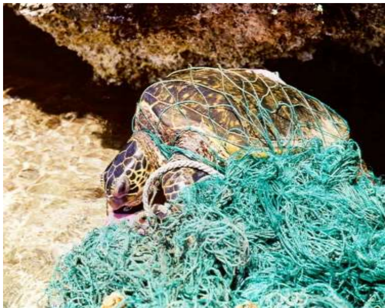
漁網に絡まったウミガメ