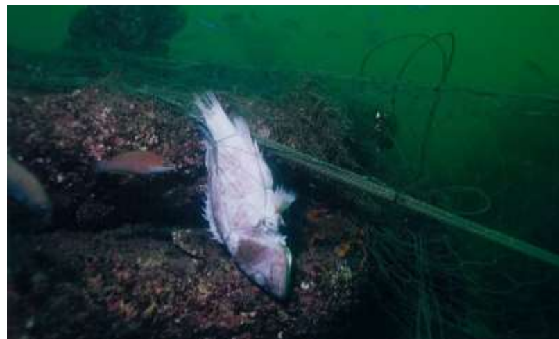
海底に遺棄された網にかかった魚 (写真：環日本海環境協力センター)

http://marinedebris.noaa.gov/multimedia/images/impacts