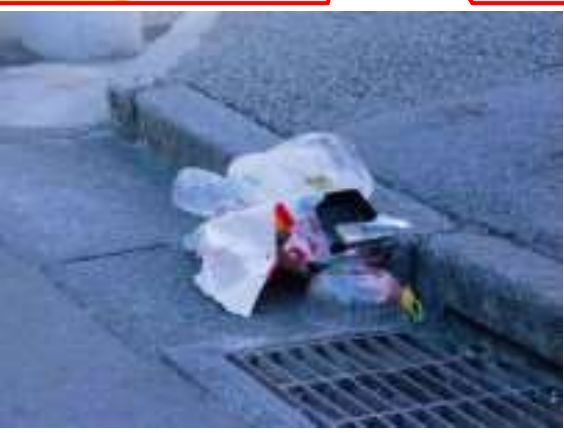
街中で見つけたごみ