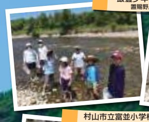
飯豊少年自然の家 置賜野川にて