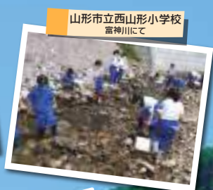
山形市立西山形小学校 富神川にて