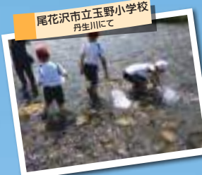
尾花沢市立玉野小学校 丹生川にて