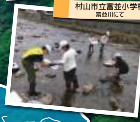
村山市立富並小学校 富並川にて