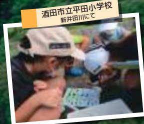
酒田市立平田小学校 新井田川にて