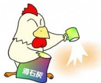
家きん舎周囲への 消石灰散布