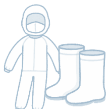
家きん舎専用 衣服・靴の使用