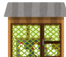
金網・ネット等の 点検および修繕