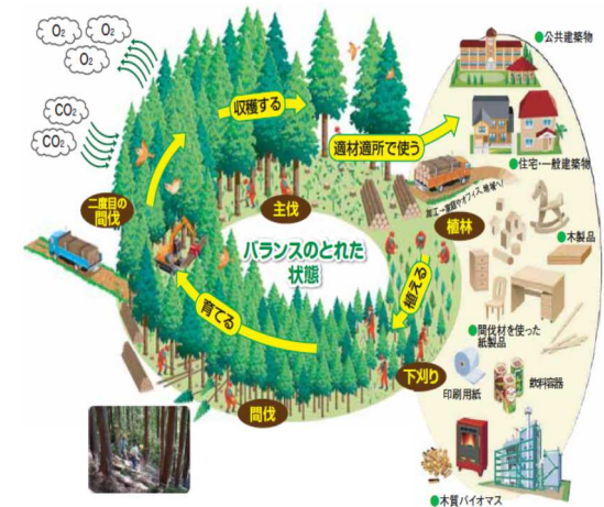
健全な森林のサイクル