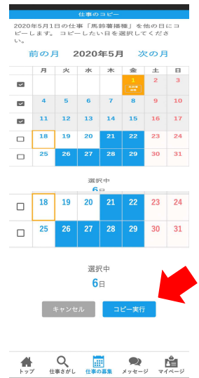
コピーで複数の日の募集