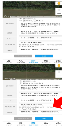
入力完了後「OK」を押す