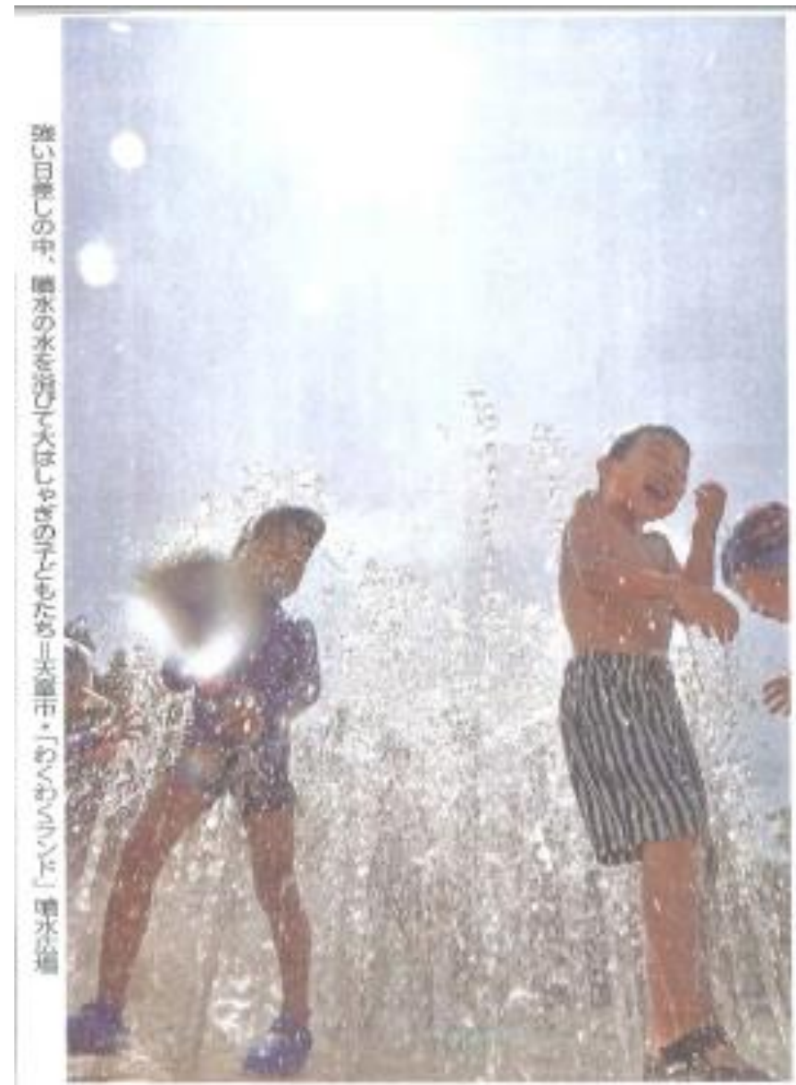
強い日差しの中、噴水の水を浴びて大はしゃぎの子どもたち＝天童市・「わくわくランド」噴水広場