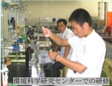
環境科学研究センターでの研修

環境科学研究センターでは、昨年度に引き続き独立行政法人（JICA）の「草の根技術協力事業」として、本県と友好県省の関係にある中国黒龍江省とハルビン市から2名の研修員を受け入れ、8月20日から9月28日まで、河川水及び河川底質中の農薬分析研修を実施しました。