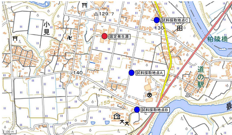
図1 固定発生源及び試料採取地点周辺地図