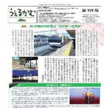
（情報誌「うえるかむ」）