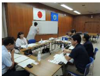
（個別支援計画検討会）