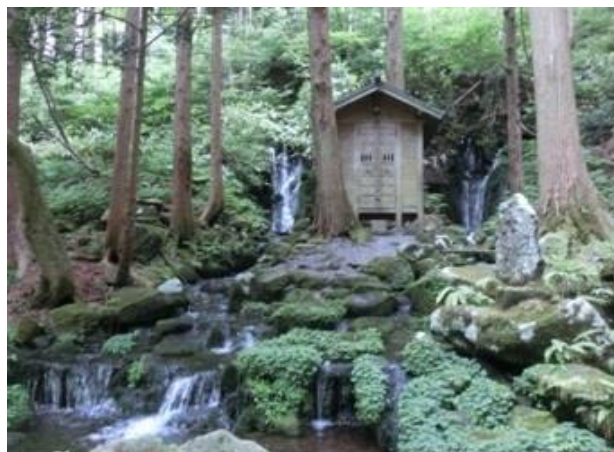
【H27選定】胴腹滝（遊佐町吉出）

県では、地域の人々に育まれてきた優れた湧水を「里の名水・やまがた百選」として選定し、県内外に広く紹介しています。 令和4年度までに、計71か所の湧水を選定しています。