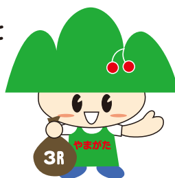
ごみゼロやまがた 県民運動キャラクター 『ごみゼロくん』