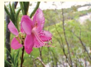
ムラサキヤシオツツジ