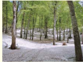
残雪のプナの原生林