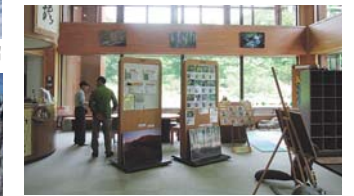
旬の情報を発信します