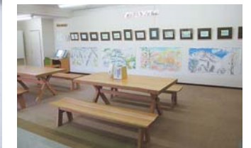
自然をみつめるギャラリー