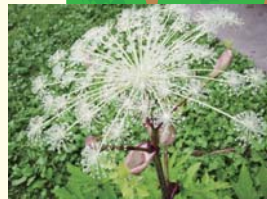
ミチノクヨロイグサ