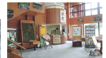
ようこそネイチャーセンターへ