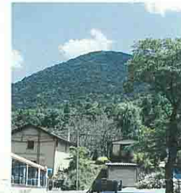
平清水から見た千歳山