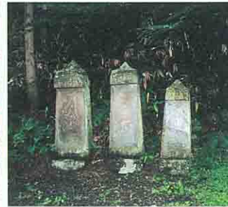
嘉暦二年大日板碑