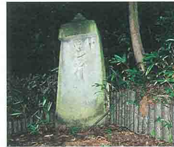
正元元年大日板碑

梨郷神社のすぐ南側にある「正元・元年・大日板碑」は、県内最古の板碑といわれ、鎌倉時代中期の正元・元年(1259)に建てられたものです。材質は凝灰岩で典型的な置賜(この地方)型板碑です。また、1kmほど先に「嘉暦二年・大日板碑」があります。これはその昔この地にあった円行寺の境内にあったもので、鎌倉時代末期の嘉暦二年(1327)年に建てられた凝灰岩製の板碑です。