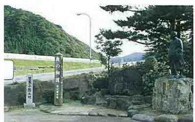
俳聖松尾芭蕉上陸の地

元禄2年(1689)江戸深川を出た芭蕉一行は同年6月3日に本合海から舟で最上川を下り、清川に上陸し羽黒山へと向っています。