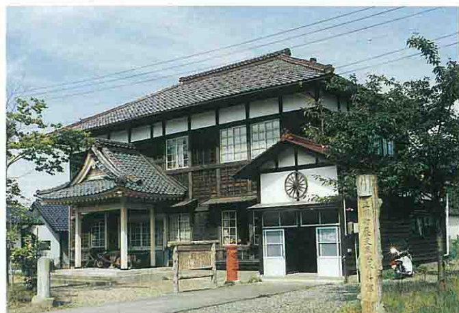
立川町歴史民俗資料館

立川町に吹く風は、遙かな時をこえて、町の中を吹きぬけていく。その永い町の歴史と人々の歩んできた道をたどるように。立川町の美しい自然や豊かな川の流れを包みこみながら未来へと導くように風はいつもやさしく舞い、いつも人々のそばで吹きぬけている。庄内の平野部ではめずらしい人間の手が入らない原生林の中の神木「なんじゃもんじゃ」のように水と緑と歴史と自然のコースです。