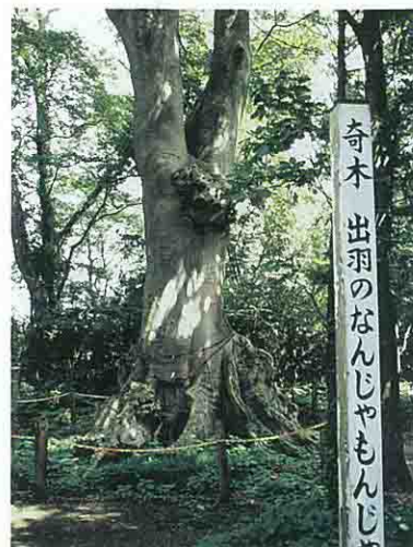
なんじゃもんじゃ

熊野神社境内にあり、出羽国風土略記に「葉は稷のごとく木はしなという木に似たり、4月実を結び秋熟し、色黒し、先年領主より御尋ねあり、枝を手下りて上けれ共、其名知る人なかりしとぞ」とあり、古来、この神木は「なんじゃもんじゃ」と呼ばれてきました。この神木は、「エゾエノキ」ではないかとされているが定かではありません。胸高直径2.9メートルの板根張りの発達した巨木です。