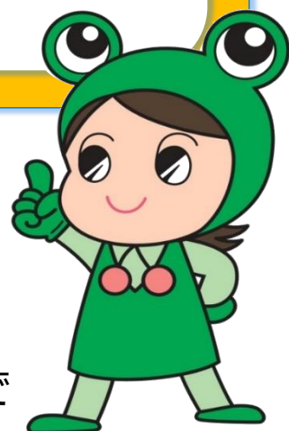
山形県消費生活センター キャラクター「クロちゃん」

電話勧誘の場合は契約書を受け取った日から8日間以内であれば、無条件で契約解除できます。