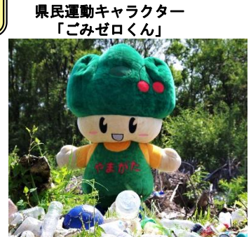
県民運動キャラクター「ごみゼロくん」