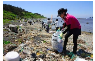
酒田市飛島の海岸での漂着ごみ