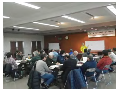
「安全な活動」について 意見交換・団体間交流