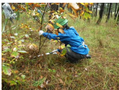
森林整備ボランティア 砂防林を育てよう