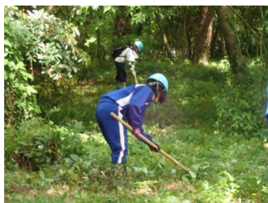
光ヶ丘松林整備 ボランティア