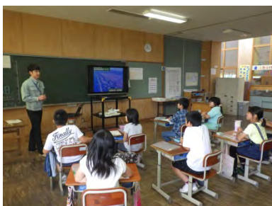
酒田市立浜中小 講話