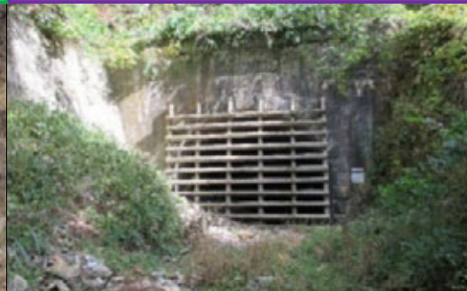
せきやまずいどう 関山隧道（山形県側）

明治13年初代山形県令・三島通庸は、山形と仙台側を結ぶ関山隧道の工事に着手しました。難工事の末、明治15年11月に開通。