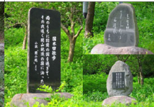
⑧ 「関山街道文学の杜」文学碑 せきやまかいどうぶんがく もり ぶんがくひ

トンネルに近い国道 48 号沿いに広い駐車スペースがあり、その片隅に日本文学に功績を残した正岡子規、長塚節、国木田独歩の 3 名の文学碑が建っています。文学碑には、関山街道を通った文人たちが記した句や小説の一節が刻まれています。