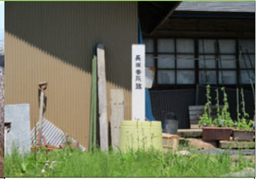
③ 長坂の関山番所跡 ながさか せきやまばんしょあと

名所としての場所の確立はありませんが、関山の見事な桜産地は一見の価値があるところです。