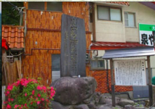
⑤ 殉難の碑 じゅんなん ひ

根回り 18 メートル、幹回り 17 メートル樹高 25 メートル株立ちとなっており、樹齢 300 年以上といわれ、昭和 35 年に山形県天然記念物に指定されているものです。