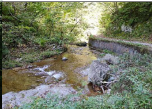
⑦ 願行岩 がんぎょういわ

国道 48 号沿いのドライブイン脇にある、高さ約 10m、横幅約 15m の大滝。巨木の間からほとぼしる清流が、轟音を立てて真っすぐに流れ落ちる光景は壮観で、東根のパワースポットとして人気を呼んでいます。