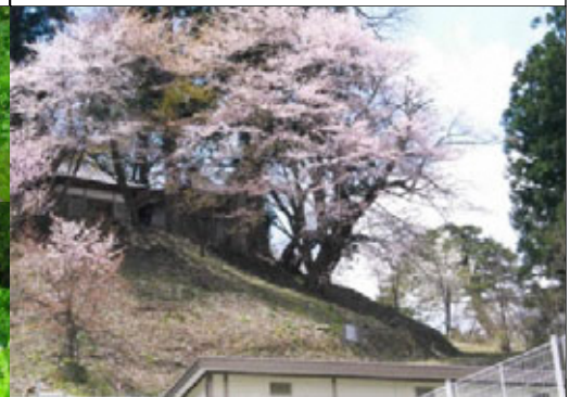
⑨ 伊豆神社の大山桜 いずじんじゃ おおやまざくら