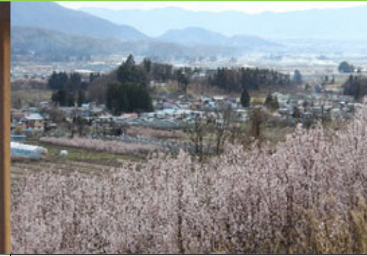
② 啓翁桜 けいおうざくら

龍泉寺の説明板では、仙台を目指してきた旅人がこの木像を託して立ち去ったとされています。後の調査で隠れキリシタンの遺物であることがわかりました。