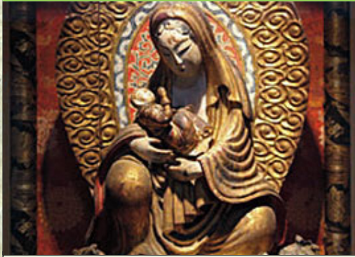
① 龍泉寺マリア観音 りゅうせんじ かのんの