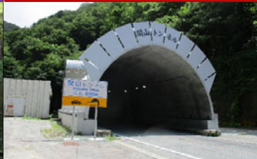
せきやま 関山トンネル

昭和の大改修が行われた関山隧道も、土石の崩落による交通の遮断、また大型車両の通行に応じきれなくなり、新たな関山トンネルとして昭和43年11月に開通しました。