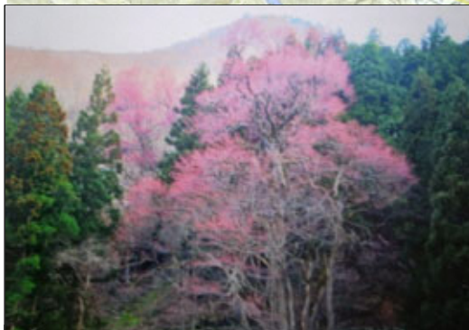
④ 大滝の桂 おおたき かつら

国道 48 号の南側の長坂集落の入口付近にある、関山街道の関所跡。山形側は関山村長坂に、仙台側は坂下に設置され、人や物資の流通を検していました。 ※標柱は個人宅の敷地内に設置されています。無断で立ち入らないでください。