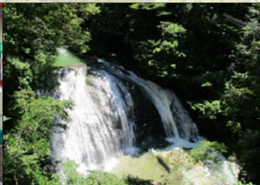
⑥ 関山の大滝 せきやま おおたき

明治 13 年、隧道工事に使用する火薬を運搬の途中、火薬に引火し、23 名の犠牲者を出す爆発事故が起きました。この碑はその供養のために建てられました。犠牲者の中には妊婦もいたそうです。三島通庸の近代化には、こうした犠牲の上に成り立っている面もあります。