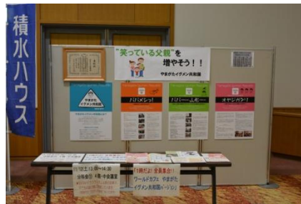
やまがたイグメン共和国