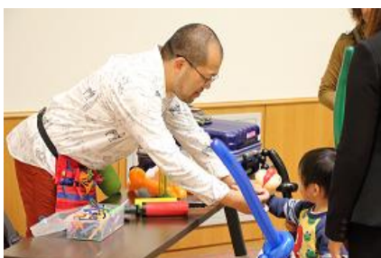
バルーンアートのプレゼント