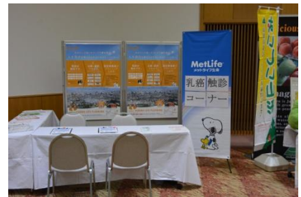
HIROKO LIFE PLANNING