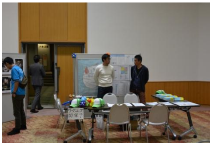
1more Baby 財団