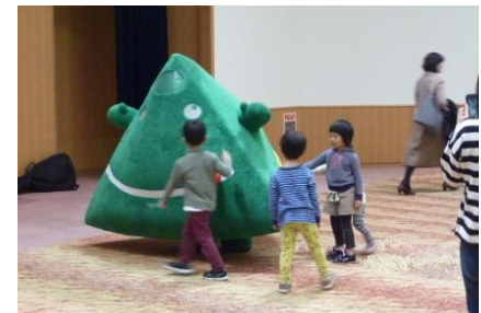
ペロリンは子供たちに大人気♪