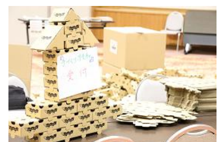
佐貞商店「段ブロック」のプレゼント