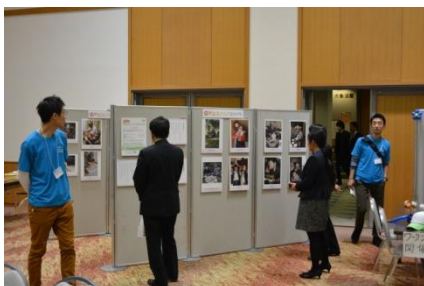
三世代家族写真・エピソードコンテスト パネル展示（山形県）