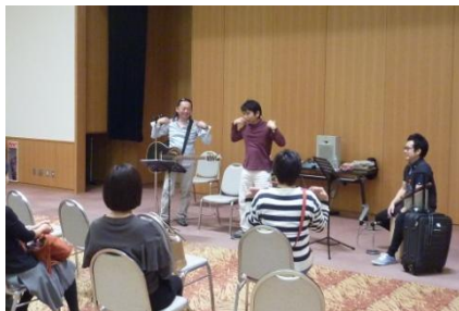
絵本ライブも開催