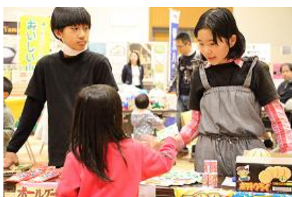
コチカラニッポンの子どもたちによる 駄菓子の販売