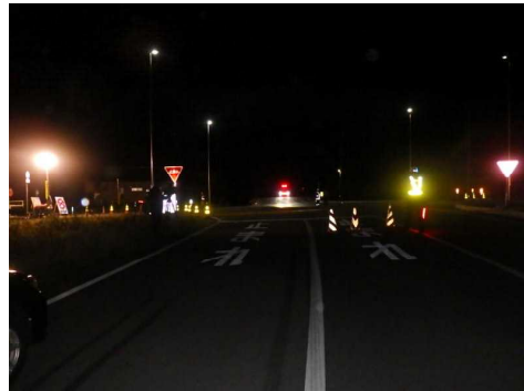
【Aから見た本件事故現場の状況】