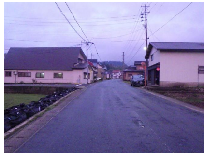
【Aから見た本件事故現場の状況】