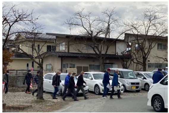
避難行動（住民・校舎内へ避難）