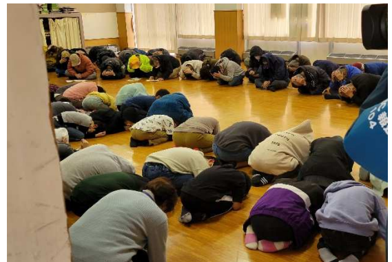
避難行動（住民と児童・校舎内）