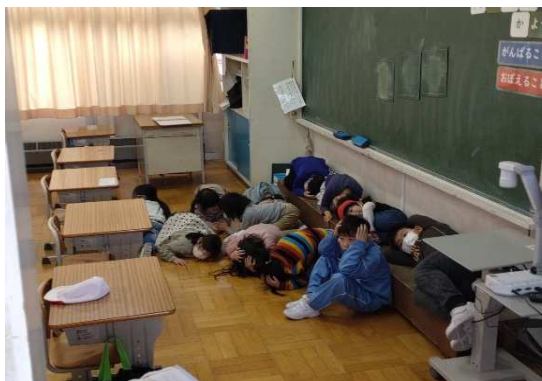
避難行動（児童・教室内）