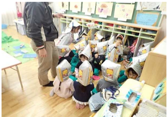
避難行動（幼稚園・室内）