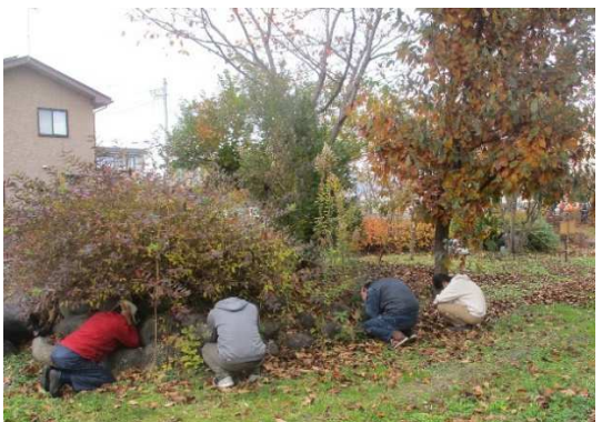
避難行動（住民・物陰に隠れる）