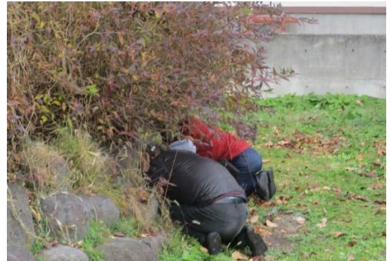
避難行動（住民・物陰に隠れる）