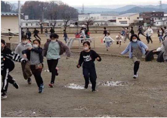
避難行動（児童・校舎内へ避難）