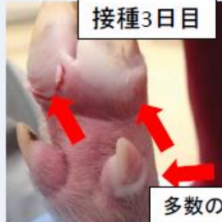
多数の水疱病変を確認