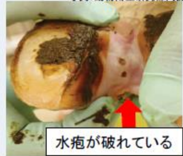
水疱が破れている