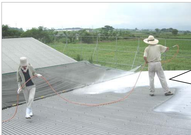
屋根への石灰の吹きつけ（宮崎県）