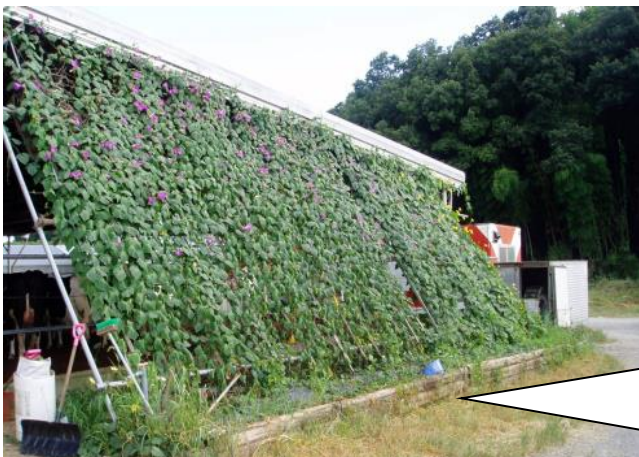
ネットに植物を這わせる（兵庫県）