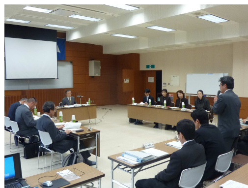
山形県公共事業評価監視委員会の状況