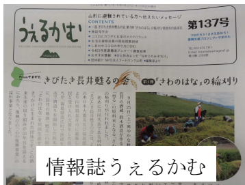
情報誌うえるかむ

○「復興ボランティア支援センターやまがた」運営支援（避難者向け情報誌・ホームページ等による情報発信、支援者に対する支援の実施）