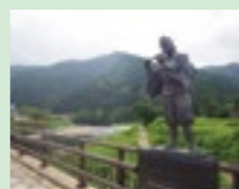
義経大橋から望む亀割山

標高:594m/新庄市・最上町/休場口コース:(歩)片道1時間30分/登山適期:6月～10月 その昔、源義経一行が平泉へ逃げのびる際に通ったのが、この山を越える亀割峠だったとの言い伝えが残っています。周辺には、「弁慶の投げ松」や「義経弁慶の視石」などの見所もあります。