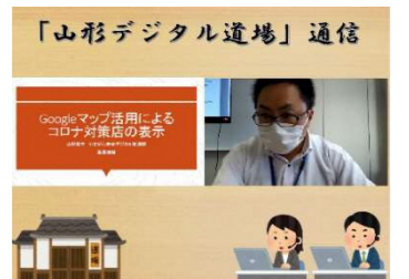
山形デジタル道場