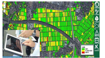
衛星リモートセンシングによる生育診断