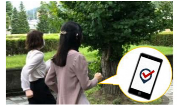
デジタルを活用したウォーキング事業(イメージ)