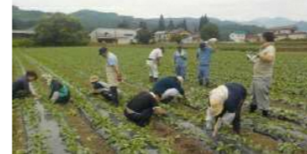
農福連携事例(大根の間引き作業)