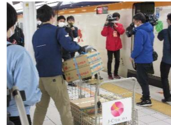
山形新幹線によるラ・フランスの荷物輸送