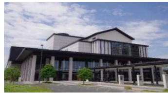
県総合文化芸術館