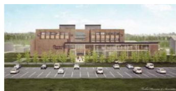
東北農林専門職大学(仮称)(イメージ)