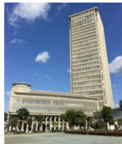
創業支援センターを設置する霞城セントラル