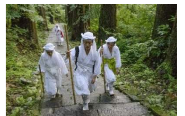
出羽三山での山伏修行体験