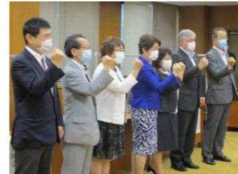
新型コロナワクチン接種事業の実施に関する合同発表