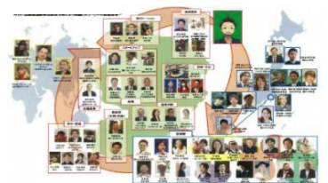
ビジネス関係人口の創出(イメージ)