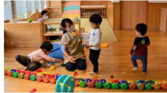
子育て支援施設での保育の様子