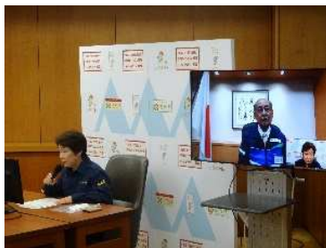
二之湯内閣府担当大臣