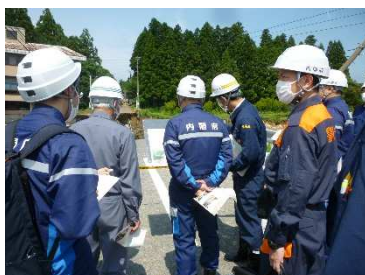
被災現場視察(飯豊町大巻橋)