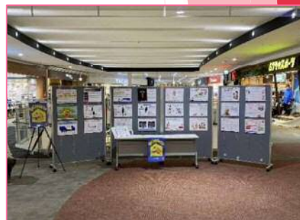
ショッピングモール (2021年)