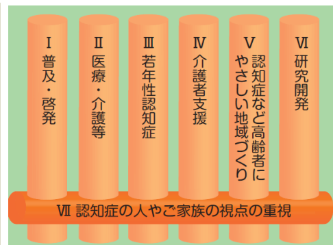
新オレンジプランの7つの柱