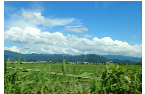
※県内在住の若年性認知症の方が撮影した車窓からの風景（県の行動計画の表紙にも掲載しております。）

次に②についてです。国の認知症施策推進大綱において、認知症の予防とは、「認知症にならない」という意味ではなく、「認知症になるのを遅らせる」ことを意味します。特に運動不足の改善や社会参加による社会的孤立の解消や役割の保持等は、認知症予防に資する可能性があるとして示唆されており、実際に、新型コロナの影響により、「外出を控える方が多くなり、認知機能の低下が見られる」といった声も聞かれています。もちろん、引き続き感染症対策をしていただく必要はありますが、軽い運動や地域の通いの場等への参加促進等に対する支援を積極的に行ってまいります。